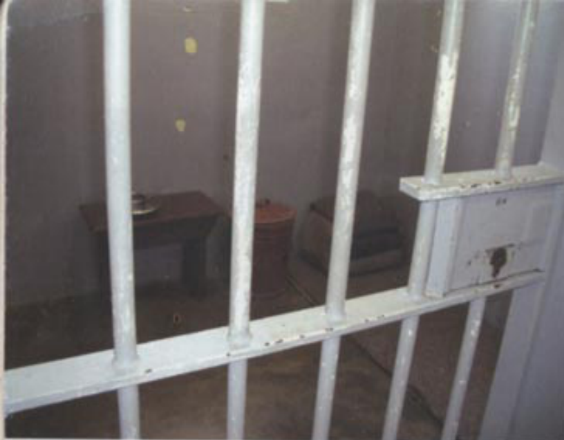
Cellene på Robben Island ga ikke mye privatliv. Dette er cella til Nelson Mandela. Den siste og den "beste".