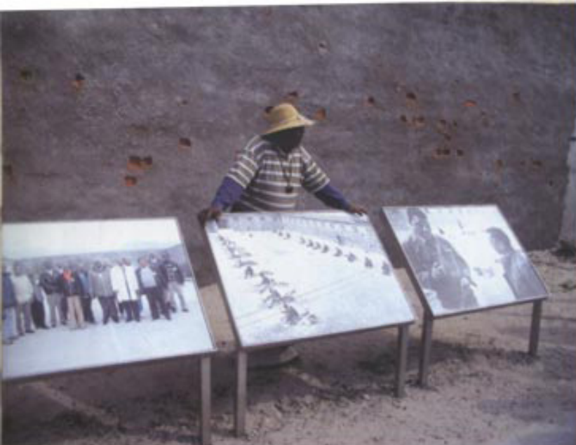
Ute i luftegården er det bilde av fangene fra den gangen. Nelson Mandela mens han var der, og da han senere besøkte fengselet som en fri mann og president.