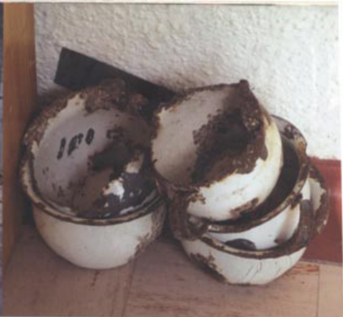
Gamle, sure minnesmerker